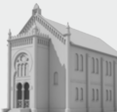
Virtuelle Rekonstruktion der Synagoge in Minden

Pädagogische Angebote zu 750 Jahre jüdisches Leben in Minden | Petershagen | Porta Westfalica